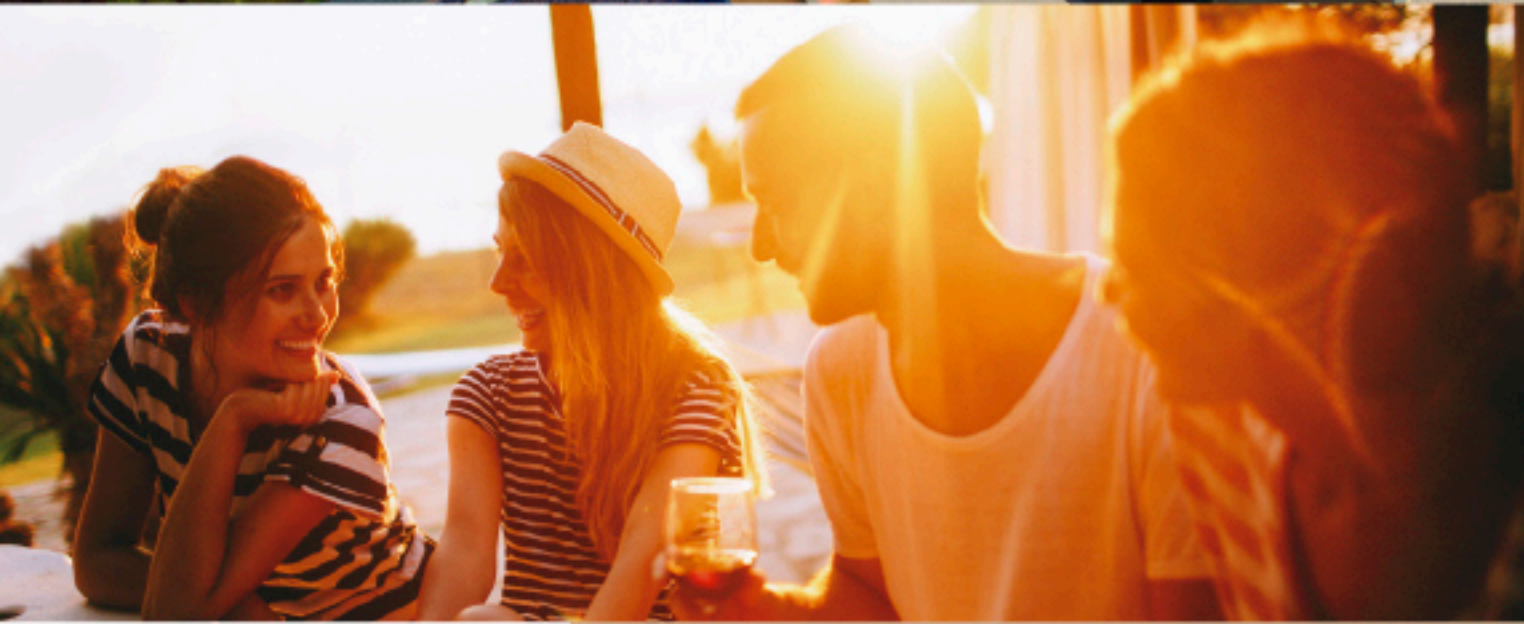
SKY DECK / ROOFTOP TERRACE